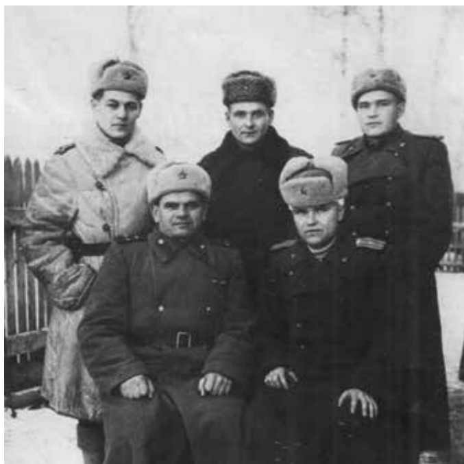
Офицеры ОКР СМЕРШ по 35 бригаде, январь 1945 года, Польша

Работа началась. В первую очередь определили наиболее опасный в диверсионном отношении объект - узловая железнодорожная станция Груец (Мазовецкое воеводство, Польша). Там стягивались эшелоны с боеприпасами, военным снаряжением, цистерны с горючим.