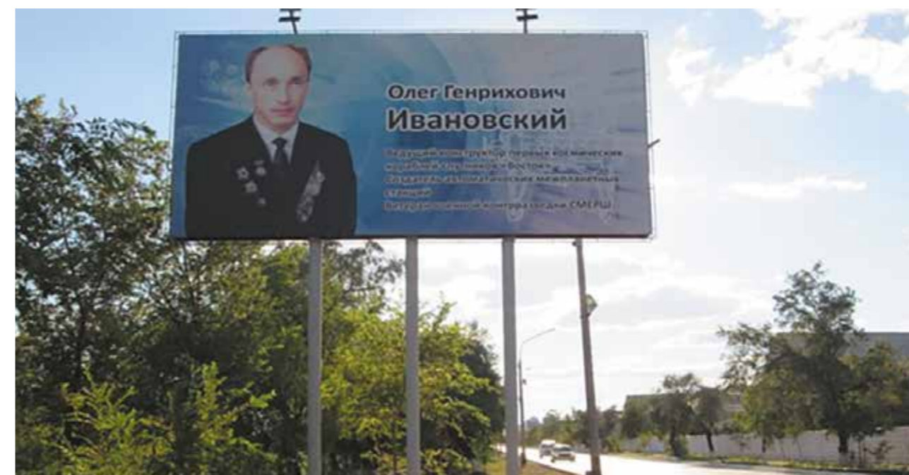
Баннер Олегу Генриховичу в г. Байконур Р. Казахстан

В космической колыбели Советского Союза – г. Байконур, на улице с говорящим именем – «Гагарина», в едином строю покорителей космоса, среди установленных баннеров с портретами генеральных конструкторов и космонавтов, свое заслуженное место занял баннер, посвященный Олегу Генриховичу.