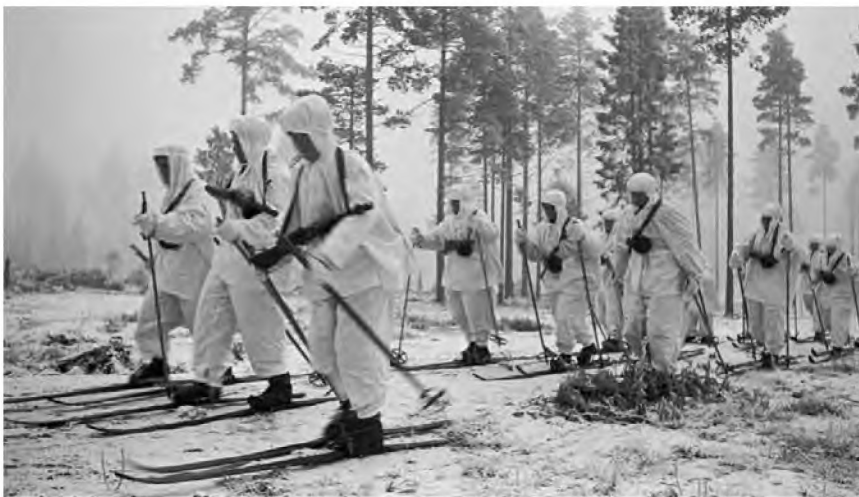
Советские лыжные «отряды дальнего действия» Зимней войны 1939 – 1940 гг.

После окончания техникума до 1937 г. работал на судоремонтном заводе Печорского речного пароходства (ПУРПА) в селе Щепьяюр Ижемского района Коми АССР на различных должностях, исполнял обязанности технического директора предприятия, совмещая с работой председателя заводского комитета профсоюза работников водного транспорта.